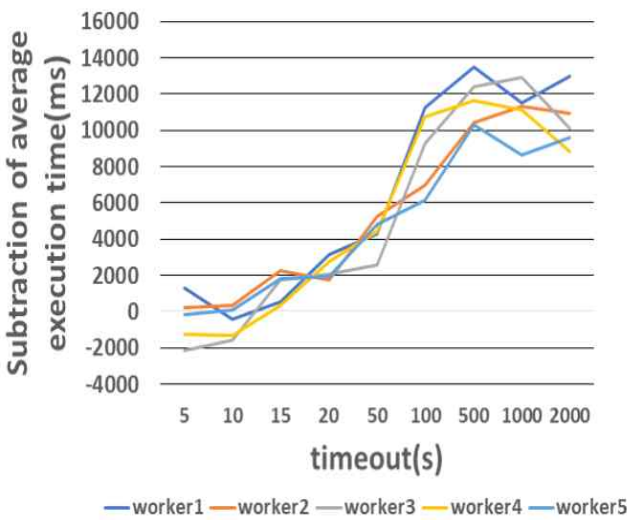
[그림 1] 스레드가 1개일 때 수행시간의 평균값 차이

수가 1개일 때 timeout에 따른 각 worker노드마다의 작업 수행시간의 평균값 차이를 나타낸 그래프이다. Timeout이 5초 지점일 때 worker3과 worker4 그리고 worker5에서 작업 수행시간의 평균값 차이가 음수인 것을 볼 수 있다. 이는 오히려 메모리 부하 작업이 수행되었을 때의 경우가 평균적으로 작업 수행시간이 더 빨랐다는 것을 의미한다. 10초 지점일 때 도 worker1과 worker3 그리고 worker4에서 같은 상황을 보여준다. 이는 이에 해당하는 각 worker노드마다 5번의 반복 작업 중 몇몇의 경우에 컨테이너를 10개씩 배분 받았다가 Docker swarm 스케줄러에 의해 컨테이너가 재배포되어 최종적으로 작업을 수행한 컨테이너의 개수가 다른 worker노드에 비해 훨씬 더 적었던 것이다. 따라서 컨테이너들 간에 메모리 경쟁이 비교적 덜 일어났고 평균적으로 작업을 수행을 더 빨리해낸 상황이 발생한 것으로 보인다. 15초 지점 이후부터는 각 작업 수행시간의 평균값이 점점 차이가 나면서 500초와 1000초 지점에서 각 worker노드마다 그래프가 최고점에 달성하는 것을 보였다. 그 이후의 시간부터는 그래프에 큰 변화가 없는 것을 볼 수 있으며, timeout을 더 늘려도 작업 수행시간의 평균값 차이는 더 이상 크게 나타나지 않았다.