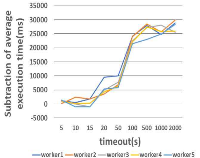
[그림 2] 스레드가 5개일 때 수행시간의 평균값 차이

서 서술한 내용과 같은 이유로 보인다. 그 이후의 시간부터는 각 worker노드마다 그래프가 증가하는 양상을 보이며 100초 지점일 때 크게 증가하는 모습을 볼 수 있다. 500초 지점 이후부터는 그래프에 큰 변화가 없는 모습을 보였다.